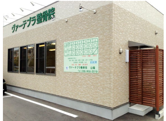
ヴァーテブラ整骨院 山陽店